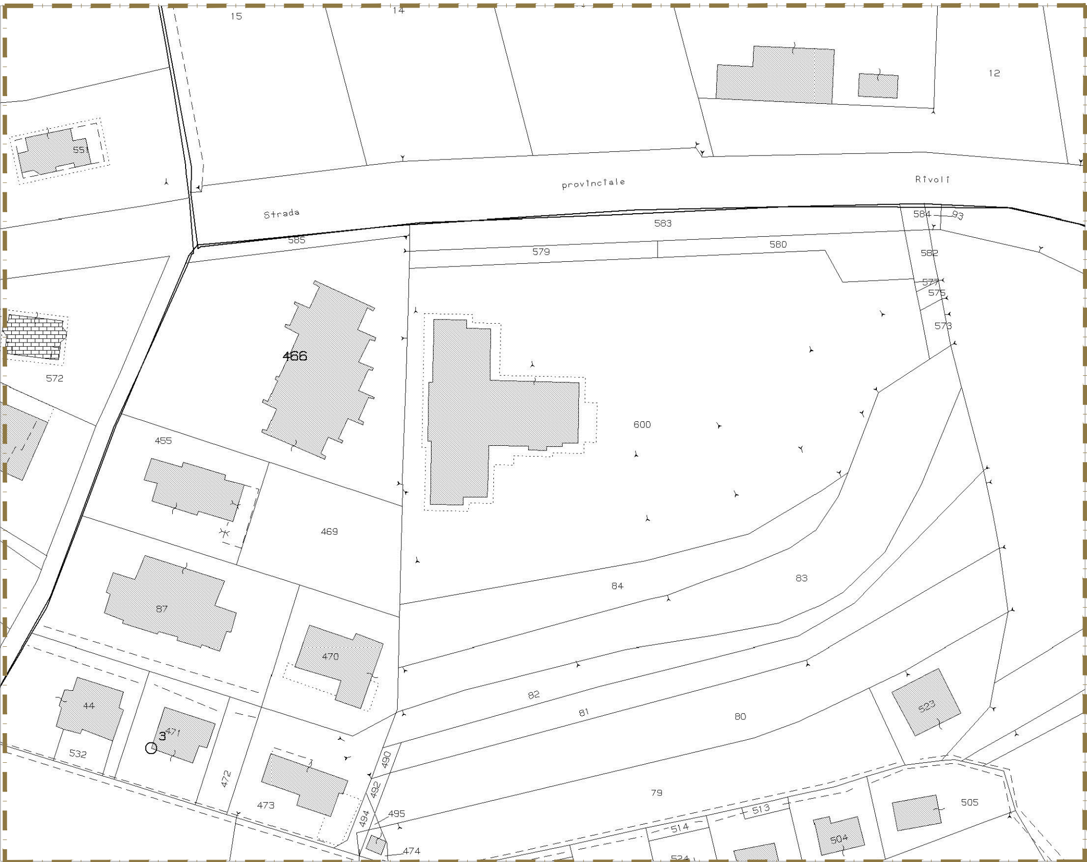
PLANIMETRIA CATASTALE - Foglio 19 Scala 1:1500